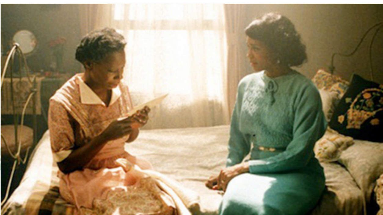
Celie leyendo las cartas de Nettie

Luego, imagina que haces una versión actual de la novela. ¿A quién le asignarías cada papel del elenco? ¿Qué cambiarías de la película original? ¿Qué incluirías? ¿Cómo compararía tu versión cinematográfica con la original? ¿Cómo se compararía tu versión con la novela?