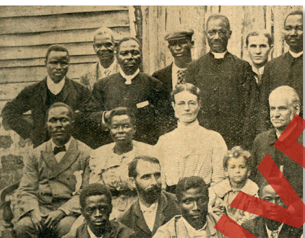
Misioneros en África