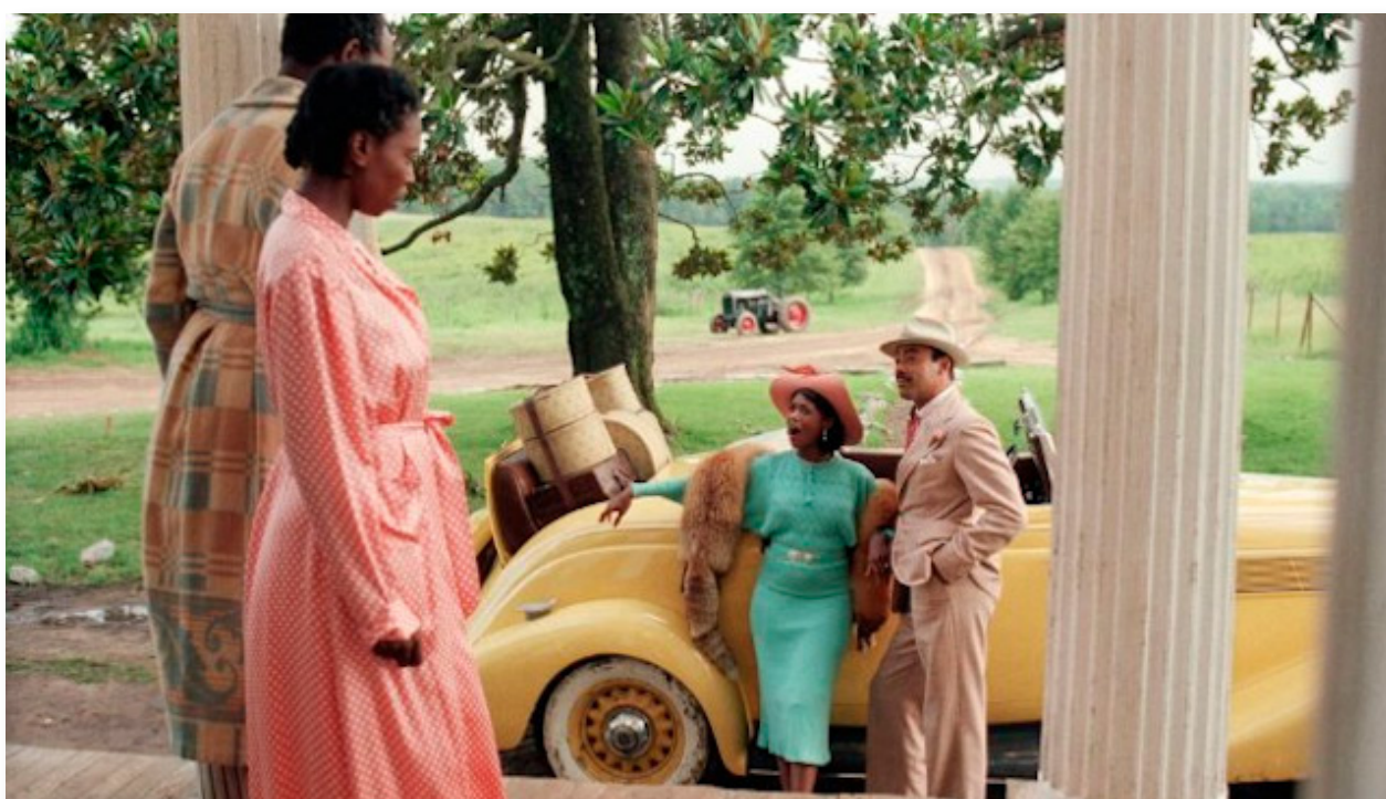
Shug vuelve con un esposo

La novela El color púrpura se publicó en 1982. En 1985, se hizo una versión cinematográfica dirigida por Steven Spielberg protagonizada por Whoopie Goldberg como Celie, Margaret Avery como Shug, Oprah Winfrey como Sofía, Akousa Busia como Nettie, Rae Dawn Chong como Squeak, Willard E. Pugh como Harpo y Danny Glover como Albert.