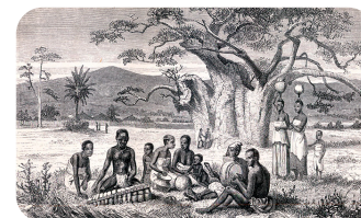
África en el siglo X