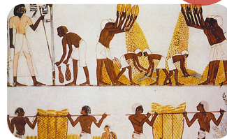
Vida diaria en el antiguo Egipto

Crema una línea de tiempo destacando los acontecimientos clave de la historia de África. Haz la conexión entre los patrones recurrentes en la historia. Luego, escribe un breve ensayo explorando estos patrones y por qué la historia podría repetirse o no.