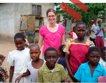
Misioneros modernos en África

"Hace ya más de cien años que los ingleses envían misioneros al África, a la India, a la China y sabe Dios."