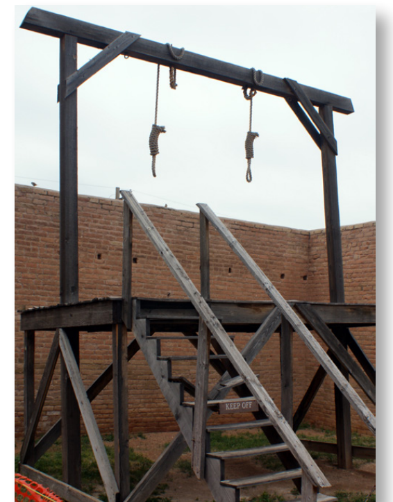
Patíbulo u horca