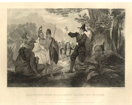
Los primeros misioneros con los indígenas americanos