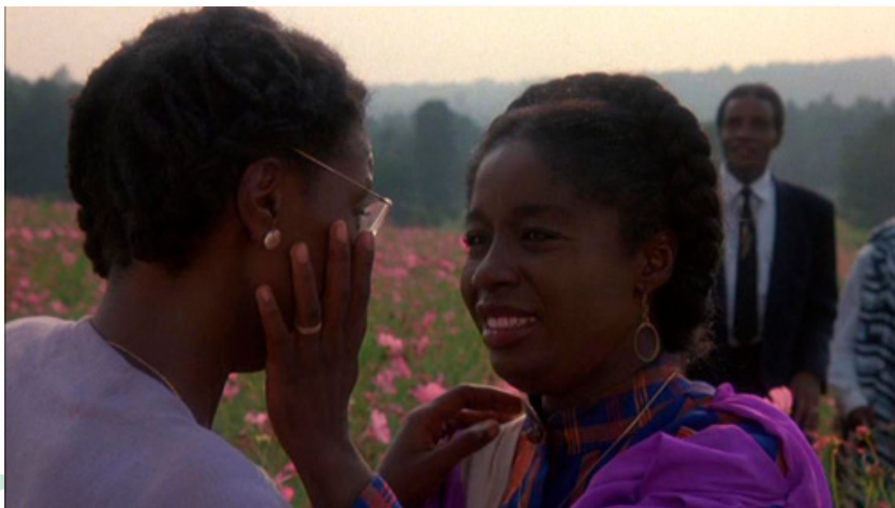
Nettie y Celie reunidas