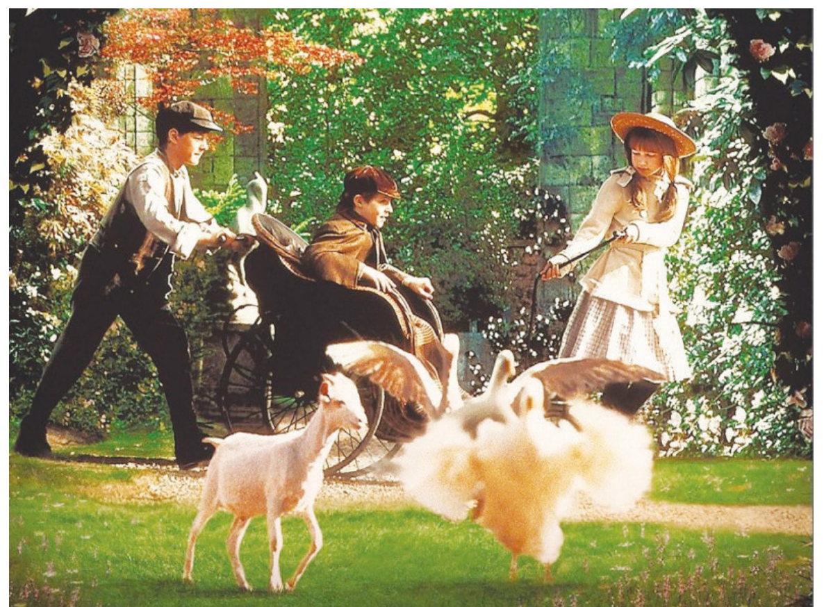
Una escena de El jardín secreto (1993)

Sé creativo. Tu descripción de la razón por la que elegiste esa escena debe tener una extensión de al menos 300 palabras.